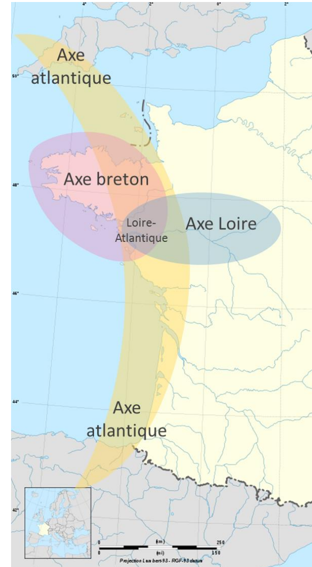
Carte schématique de Bretagne des principales aires culturelles