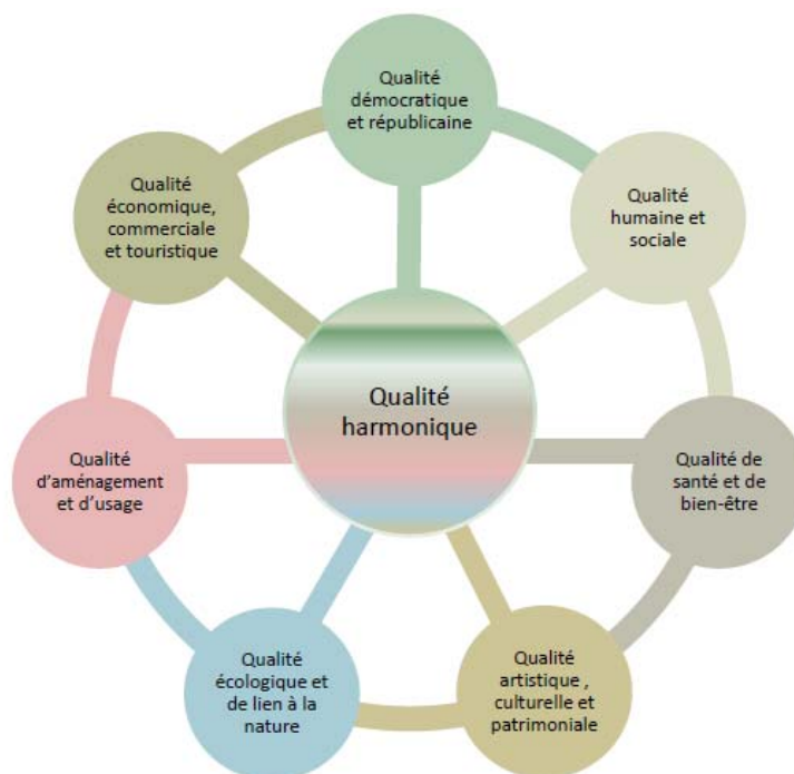
Figure 1. La qualité « harmonique » des espaces publics (idéal-type)

Dans l'espace public, tout est affaire d'équilibre. Les espaces publics matériels et immatériels sont en quelque sorte la « table d'harmonie » d'une société démocratique.