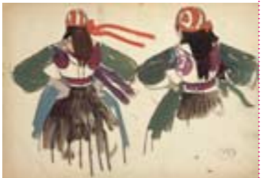
MÉHEUT Mathurin « Les fillettes de Plougastel » © ADAGP, Paris 2008