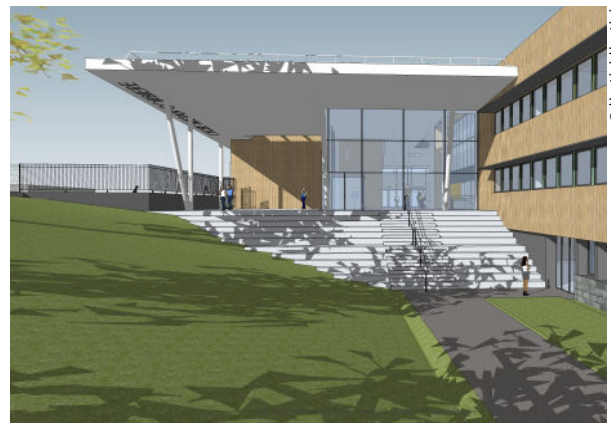
Le parvis couvert et le hall, vus depuis le bas d'un bâtiment d'enseignement (bât. B), le long de la rue de Kervéguen