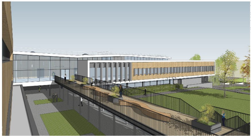
Le futur bâtiment, vu depuis l'intérieur du lycée, avec la passerelle et la cour paysagère

Très lumineux, le hall d'accueil instauré entre les bâtiments donnera accès à une passerelle extérieure en lien direct vers les ateliers. Elle surplombera une nouvelle cour paysagère, végétalisée et arborée, qui tirera parti de l'inclinaison du terrain pour mettre en valeur la perspective vers l'internat. Enfin, côté sud du site, le bâtiment D sera lui aussi traité avec sa mise en accessibilité par l'installation d'un ascenseur et par l'aménagement d'espaces extérieurs qui remplaceront l'ancien CDI.