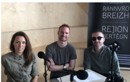
Avec Letyss et Reynz, une émission 100% brestoïse !