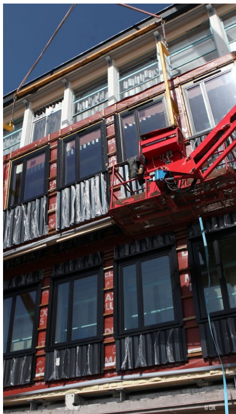
Pré-montage des façades en technique «Lego».