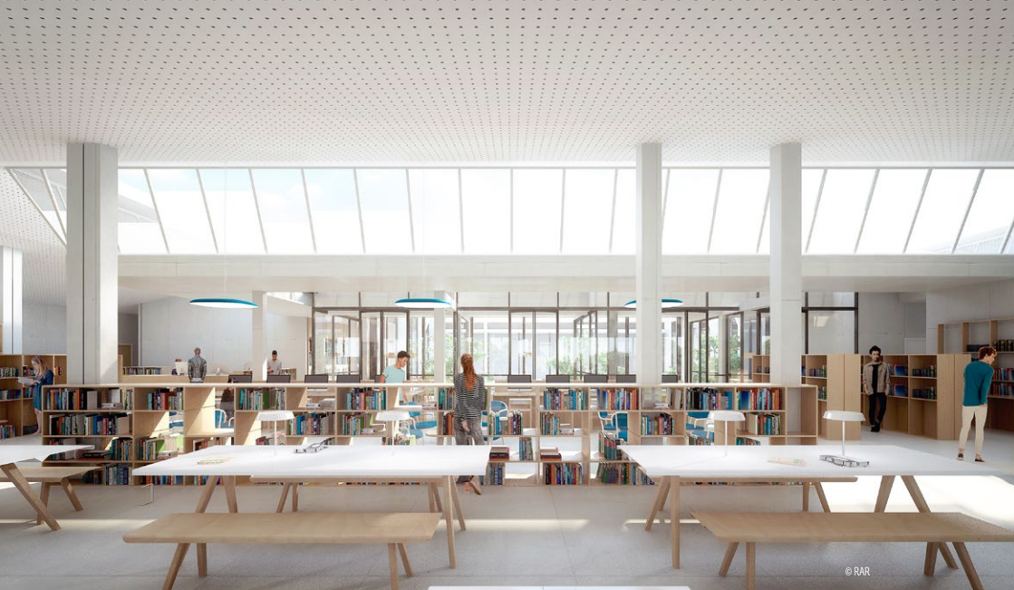
Centre de documentation et d'information