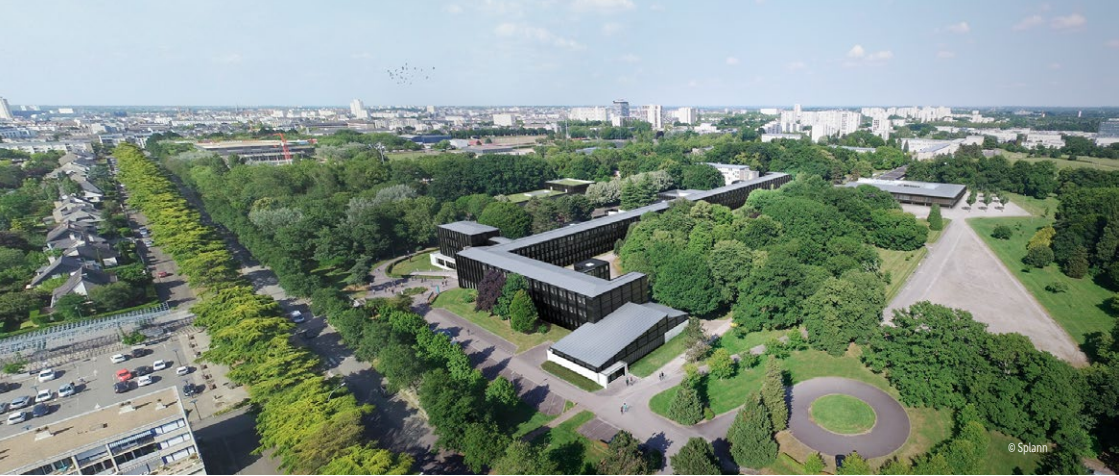
Vue générale du lycée