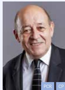
Jean-Yves Le Drian