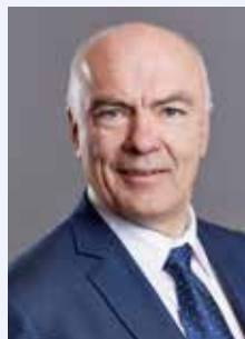
Marc Le Fur